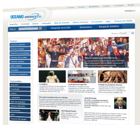
Nueva home de Océano Universitas.

El nuevo Océano Universitas presenta una renovada imagen en la línea de los actuales desarrollos web y portales de conocimiento. Se ha apostado por una estética moderna y atractiva sin olvidar en ningún momento la usabilidad y el rápido acceso a los contenidos. Los contenidos digitales se organizan con una estructura temática y ofrecen una atractiva presentación, cuyos criterios de diseño facilitan su comprensión intuitiva. Todo ello combinado con la alta funcionalidad del producto.