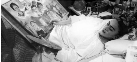
Frida Kahlo pintando en la cama.

Entre los nuevos contenidos incorporados a los productos de la línea Océano Digital destacan los relativos a la conmemoración del bicentenario de independencia de México y Chile, celebrados en septiembre de 2010. Asimismo, también se han incorporado nuevos materiales relativos a la vida y obra de la pintora mexicana Frida Kahlo.