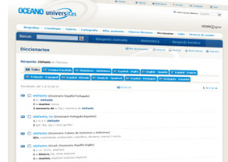
Resultados de una búsqueda en Océano Universitas.

En la misma línea, Océano Universitas también permite la integración en Metalib, el portal para bibliotecas de Ex Libris.