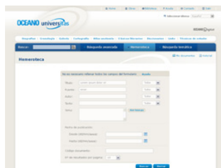
Búsqueda de contenidos de revistas en Océano Universitas.

En la home de Océano Universitas encontramos una variada selección de contenidos destacados, que nos permiten hacer una primera aproximación al fondo editorial. En este sentido, el usuario tiene a su alcance más de 500.000 contenidos permanentemente actualizados que le ofrecen una visión completa de todos los temas de interés, tanto desde el punto de vista teórico como práctico.