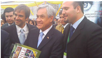
Sebastián Piñera con un volumen de Enciclopedia Escolar de Chile .

El 23 de abril, con motivo del Día Internacional del Libro y del Derecho de Autor, se inauguró la Feria del Libro de la Plaza de Armas de Santiago de Chile, a cuyo acto principal asistió el presidente de la República, Sebastián Piñera, así como otras personalidades del mundo político y cultural.