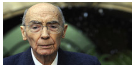
El escritor portugués José Saramago (1922-2010).

líder del Partido Conservador y actual primer ministro británico; Michael Stern Hart, filántropo estadounidense y fundador del Proyecto Gutenberg, una biblioteca electrónica universal, o Juan Manuel Santos, elegido nuevo presidente de Colombia en las elecciones de 2010. Además, se ha actualizado la biografía del narrador y ensayista portugués José Saramago (1922-2010), Premio Nobel de Literatura 1998, que falleció el 16 de junio de 2010.