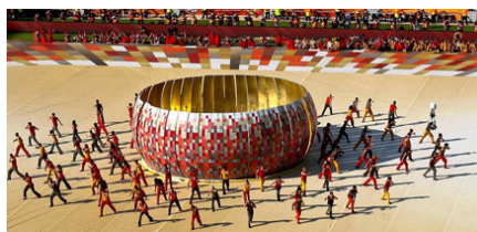
Ceremonia de la inauguración del Mundial de Fútbol 2010.

En el ámbito de los deportes, el documento titulado Sudáfrica acoge el Mundial de Fútbol del 2010 ofrece información sobre la celebración de la fase final de la XIX edición de la Copa Mundial de la FIFA, que por primera vez tiene lugar en un país del continente africano.