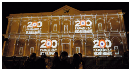
Celebración del bicentenario de la independencia del Paraguay.

El Cabildo, en Asunción (Paraguay), uno de los actos conmemorativos del Bicentenario de la Independencia del Paraguay, que se celebra en 2011.