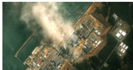
Vista aérea de la central nuclear de Fukushima, Japón.

Entre los últimos contenidos de actualidad publicados destacan los relativos a la tragedia provocada por el seísmo de Tohoku, Japón, y la posterior fuga radioactiva en la central de Fukushima; la muerte del saudí Osama Bin Laden, fundador de la organización terrorista Al-Qaeda, abatido por el ejército estadounidense o el brote epidémico por Escherichia coli O104:H4 iniciado en Alemania.